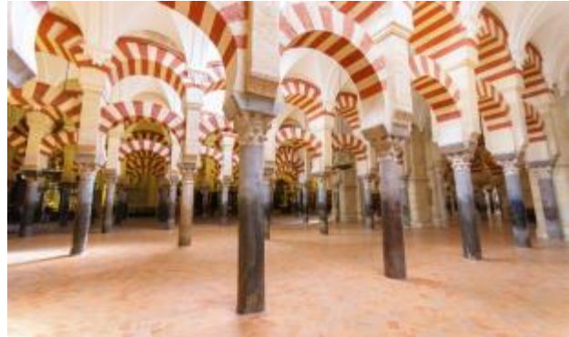
La Mezquita de Córdoba