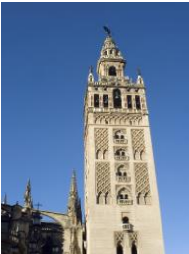
La Giralda, en Sevilla

Los moros llegaron a España en el año 711.