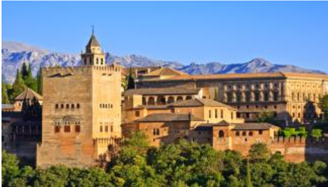
El palacio de la Alhambra, en Granada