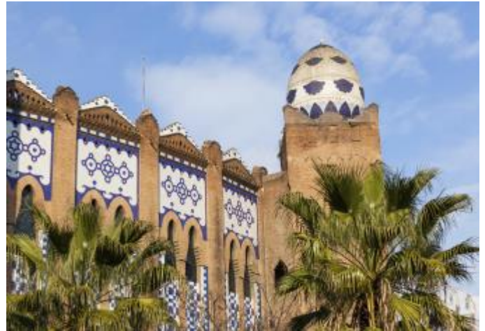
La Monumental, Barcelona.

La plaza de toros puede convertirse en mezquita, centro comercial o sala de espectáculos.