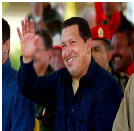
Hugo Chávez Presidente de Venezuela 1999-2013