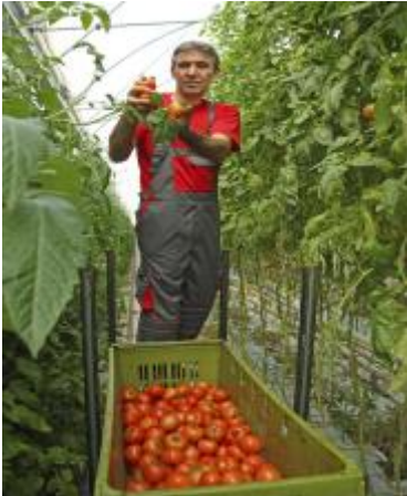
El sector agrícola

En 2013 había 5,5 millones de extranjeros en España, el 11,70% de la población total.