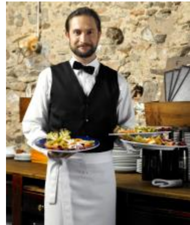
El sector de los servicios

Fuente: Instituto Nacional de Estadística (INE) enero de 2013