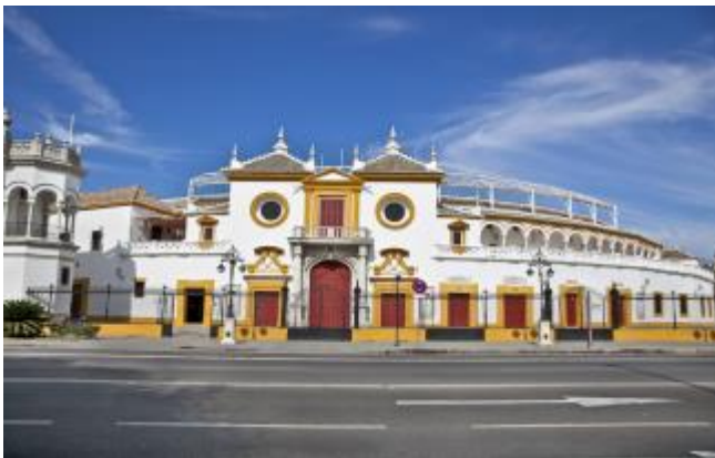
Plaza de toros, Sevilla

“La tauromaquia es algo más que un espectáculo público: forma parte de la identidad y cultura de Andalucía.”