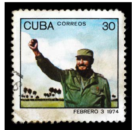
Fidel Castro Primer Ministro de Cuba 1959-1976 Presidente de Cuba 1976-2008