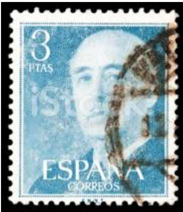
Francisco Franco Caudillo de España 1939-1975