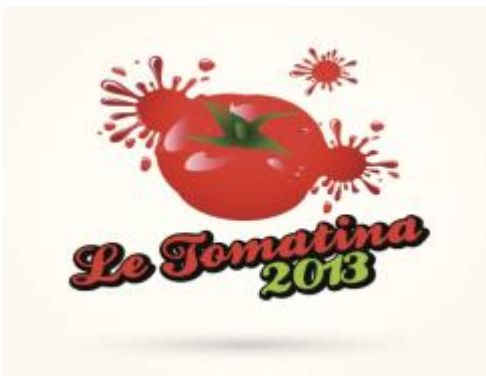
Una fiesta de agosto

La ciutat de València compta el 2009 amb un total de 814.208 habitants, segons dades de l'INE.