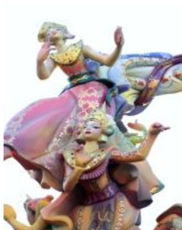
Las Fallas y el nit del foc