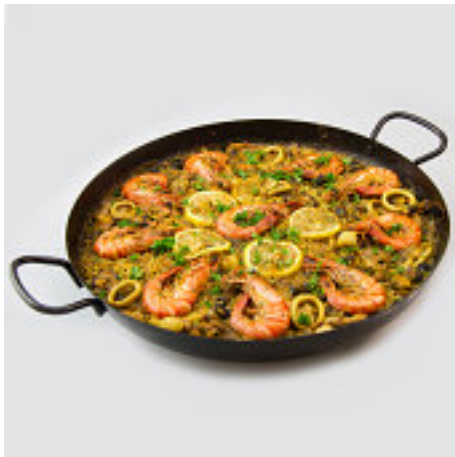
La paella valenciana